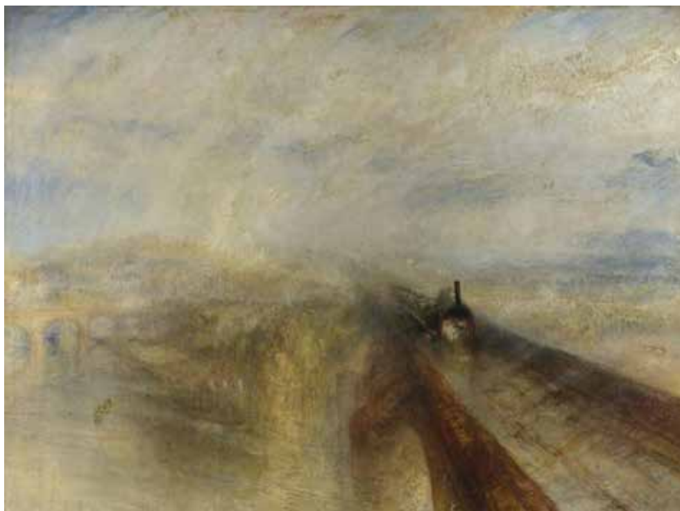
Уильям Тёрнер. Дождь, пар и скорость, 1844 г.